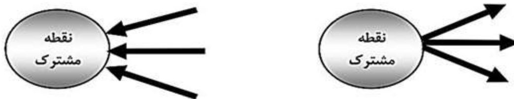
شکل شماره ۲-۳. مفهوم تفکر واگرا (سمت راست) و تفکر هم گرا (سمت چپ)

عمده مطالب این دیدگاه، در مورد ویژگی های شخصیتی، شناختی و انگیزه افراد می باشد. (سام خانیان، ۱۳۸۷) گیلفورد ۱۲ دانشمند آمریکایی است که جامع ترین نظریه مربوط به خلاقیت را در سال ۱۹۹۵ ارائه داده است. وی معتقد است که خلاقیت یکی از جنبه های اصلی تفکر یا اندیشیدن است. تفکر عبارت است از فرایند بازآرایی یا تغییر اطلاعات و نمادهای کسب شده موجود در حافظه دراز مدت. به عبارت دیگر، فعالیت های جهت دار ذهن برای حل مسأله. افرادی که تفکر واگرا دارند در فکر و عمل خود با دیگران فرق دارند و از عرف و عادت دور می شوند و روش های خلاق و جدید را به کار می برند. برعکس، کسانی که از این خصوصیات برخوردار نیستند تفکر هم گرا دارند و در فکر و عمل خود از عرف و عادت پیروی می کنند. همان طور که در شکل شماره ۱ (۱) نشان داده شده است تفکر واگرا یعنی دور شدن از نقطه مشترک که همان رسم، سنت و عرف اجتماع است و تفکر هم گرا یعنی نزدیک شدن به آن نقطه.