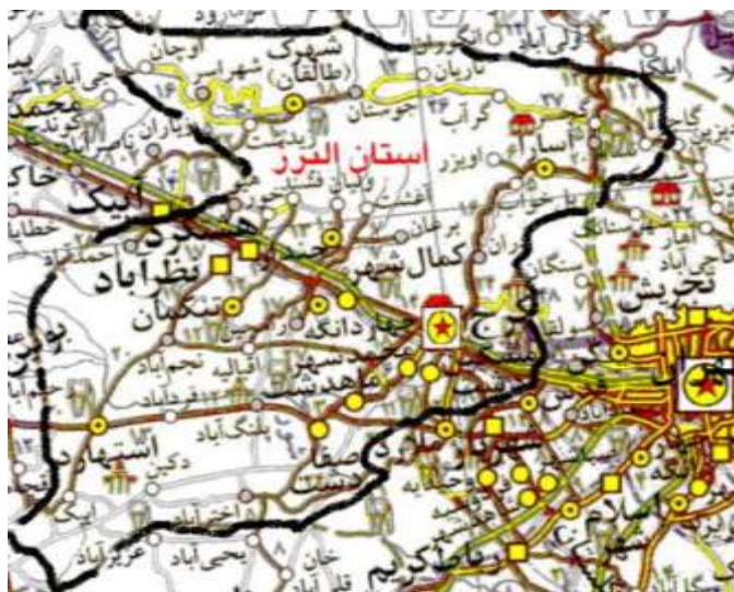
شکل (۱) روستاهای تحت نفوذ و همجوار با شهرک صنعتی سپهر

شیوه نمونه گیری براساس روش تصادفی است، و نمونه ها بطور تصادفی از روستاهای تحت نفوذ و همجوار با شهرک صنعتی سپهر که شامل : نجم آباد، خرم آباد، شاه بداغ ، شیخ حسن، فتح آباد، قبیچاق، قزل حصار، قشلاق محمدلو، محمد آباد افخم الدوله، میلک سرکار، وایه بک، گل دره، قوچ حصار، مزرعه عزیز آباد، مزرعه اژدری، ازبکی، زمان آباد، مهدی آباد، ابراهیم جیل، تنکمان، بختیار، حسین آباد، قارپوزآباد، رضا آباد، خانی بیگ، باقرآباد فاضل، مغرور آباد، میمون آباد، مسکین آباد، احمد آباد ، همت آباد، کاظم آبا ، دنگیزک، حسن مجدالدوله، قلعه شیخ، حسن بکول، صفر خواجه کله بهرام، گازرسنگ می باشد انتخاب شدند. وضعیت ناحیه مورد مطالعه به ترتیب در شکل شماره ۱ نشان داده شده است.